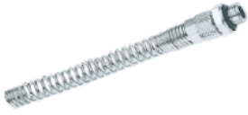
1028 - Düz Erkek Yaylı