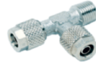
1220 - Sabit Te Yan