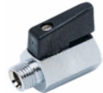
6060 - Küresel