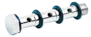
51430 - Üçlü Saplama