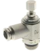
57905 - Akış Ayar Silindir İçin 57915 - Akış Ayar Valf İçin