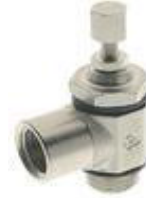
8957 - Akış Ayar Valfi (Silindir İçin) 8967 - Akış Ayar Valfi (Valf İçin)