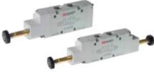
5/2 Bobin Uyarılı Valfler