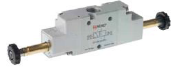
3/2 Çift Bobin Uyarılı Valfler