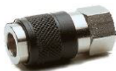
182 - Gövde (Dişi)