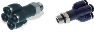
55345 - Beşli Ye