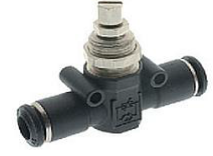
55940 - Akış Ayar