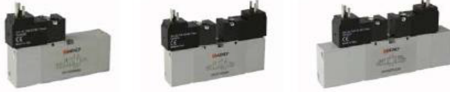
18mm VDMA Bobin Uyarılı Valfler