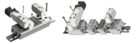
3/2 - 5/2 Valf Pleytleri