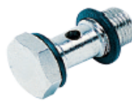
LG410 - Tekli Saplama