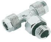
1215 - Döner Te