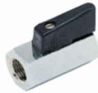
6065 - Küresel