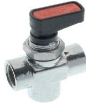
6710 - Küresel 3 Yol