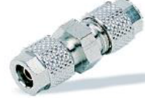
1040 - Nipel