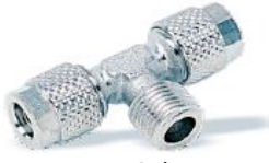
1200 - Sabit Te