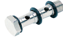
51420 - İkili Saplama