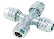
1300 - Kruva