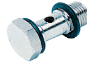
51410 - Tekli Saplama