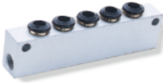
50900 - Blok