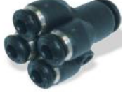
55330 - Beşli Ye