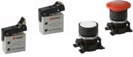
M5 - 3/2 ve 1/8 - 3/2 & 5/2 Valfler