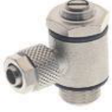
8950 - Akış Ayar Valfi (Silindir İçin) 8960 - Akış Ayar Valfi (Valf İçin)