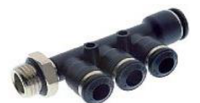
55365 - Üçlü Manifold