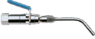
321 - Hava Tabancası