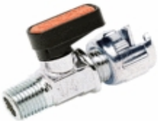
6460 - Küresel