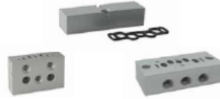
18mm VDMA Pleyt ve Aksesuarları