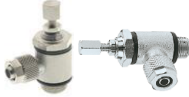
8955 - Akış Ayar Valfi (Silindir İçin) 8965 - Akış Ayar Valfi (Valf İçin)