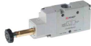
3/2 Tek Bobin Uyarılı Valfler