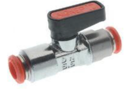
6560 - Küresel