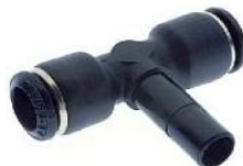
55240 - Te