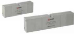
18 mm VDMA Hava Uyarılı Valfler