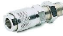
116 - Gövde (Pano Tipi)