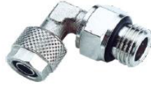
1115 - Döner Dirsek