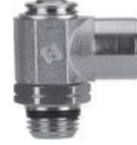
8952 - Akış Ayar Valfi (Silindir İçin) 8962 - Akış Ayar Valfi (Valf İçin)