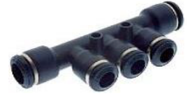
55350 - Üçlü Manifold