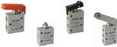
Limit Valfler 3/2 & 5/2