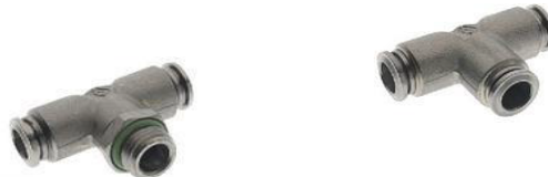
70230 - TE