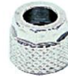
1700 - Somun