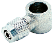
1500 - Halka Tekli