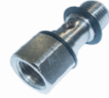
51440 - Tekli Saplama (Dişi)