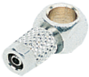
LG500 - Halka Tekli