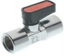
6300 - Küresel D-D