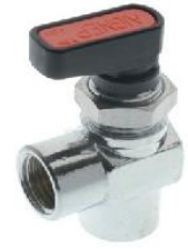
6720 - Küresel