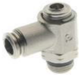
57901 - Akış Ayar Silindir İçin 57910 - Akış Ayar Valf İçin