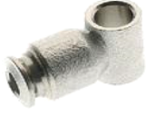
57505 - Tekli Halka