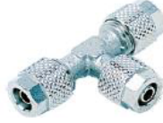
1230 - Ara Te