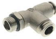
57226 - Döner TE