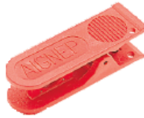
1750 - Hortum Kesici