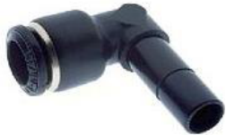
55140 - Dirsek