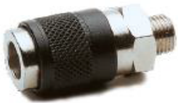
181 - Gövde (Erkek)