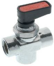
6700 - Küresel 3 Yol