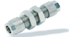
1050 - Pano Nipel