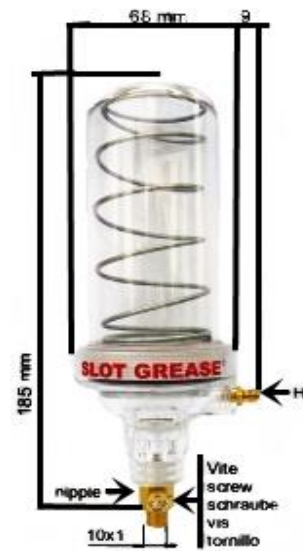
SLOT GREASE® 220 A